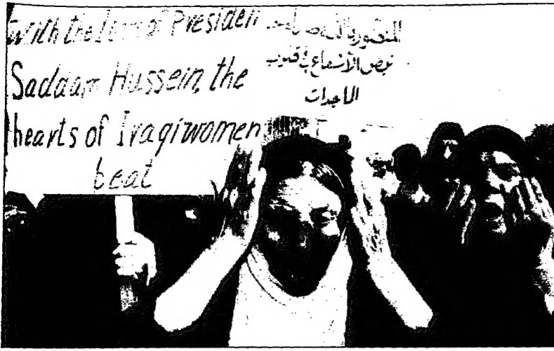
مظاهرات عراقيات يطرقن في تشييع الجنرال بيهاد أسد (أوس)